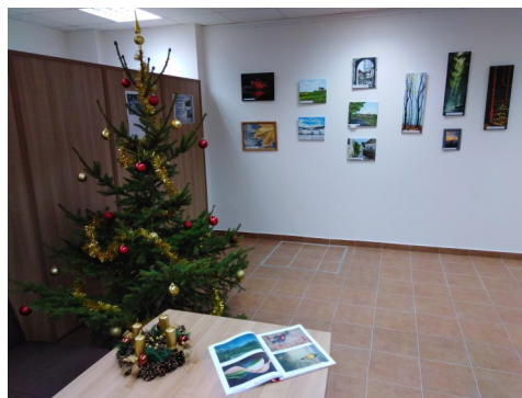
Výstava obrazů v infocentru