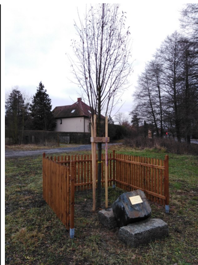
Lípa republiky na Sýkorce