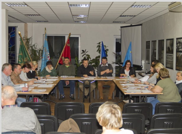
Z veřejného zasedání zastupitelstva 11. 12. 2018